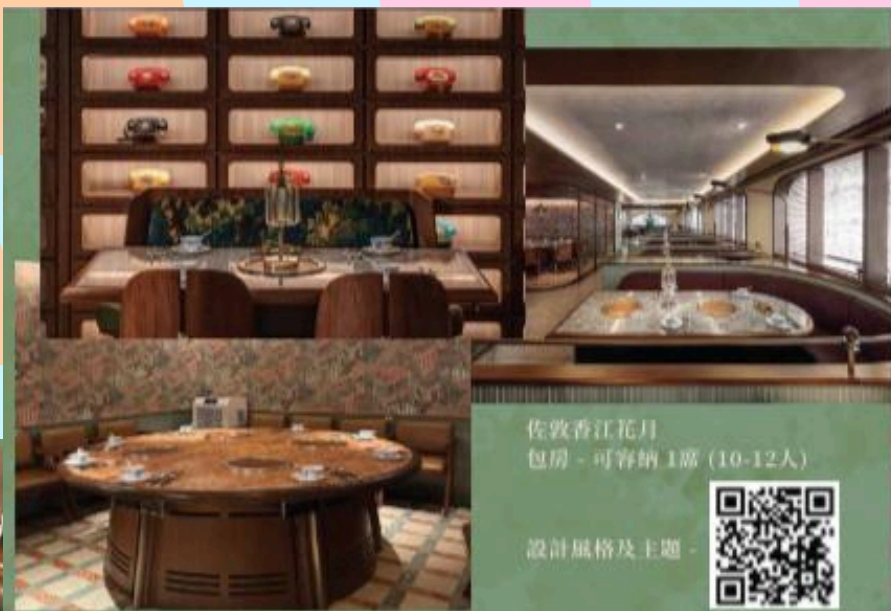
佐敦香江花月 包房 - 可容納 1席 (10-12人)